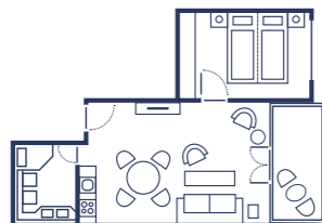
2-Raum Suite „Standard“ oder „Meerblick“, mit Balkon, 45 qm