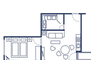
2-Raum Suite „Dünenblick“, mit Balkon, 42 qm